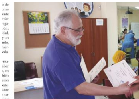
Escuela de Segunda Oportunidad del Proyecto Fratelli

Ora che abbiamo raggiunto una certa conoscenza del contesto e del nostro territorio, il nostro piccolo team ha iniziato, tra le altre cose, a formulare alcuni progetti per